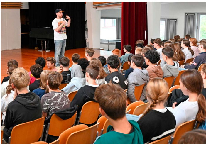
↑ Gemeinsam mit Rapper Manillio widmeten sich die Jugendlichen eine Stunde lang dem Urheberrecht.