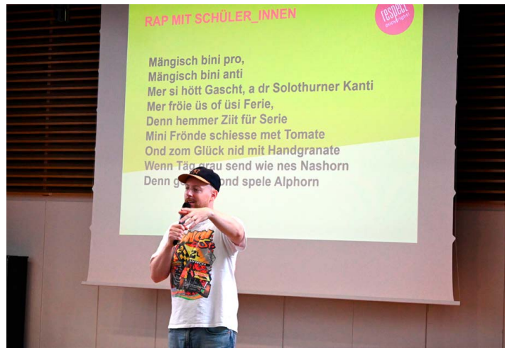
↑ Manillio produzierte mit den Jugendlichen kurzerhand einen Song – und spielte den auch sogleich.