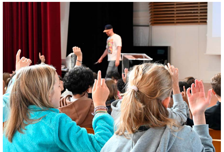
↑ «Wer von euch hat ein Smartphone?» Die Veranstaltung war insgesamt sehr interaktiv.