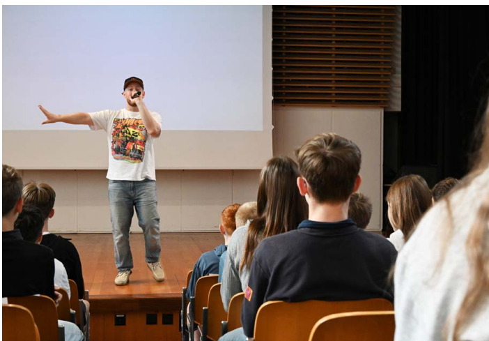
↑ Der Rap fand bei den Jugendlichen grossen Anklang.