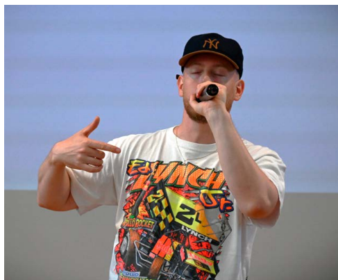
↑ Was nicht fehlen durfte: Live Performance von Manillio.